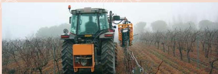
Prepodadora trabajando en un viñedo

Una vez que el sarmiento se ha secado y las hojas han caído, ya se puede realizar la pre poda. Es el trabajo realizado en las cepas en espaldera que consiste en cortar una gran parte del sarmiento seco, dejando sólo unos centímetros, antes de proceder a la poda manual. Con esta operación se facilita en gran medida la poda, con el consiguiente ahorro de trabajo y tiempo, dado que se evita tener que desliar los sarmientos, que de estar enteros, mantendrían los zarcillos unidos a los alambres de la espaldera.