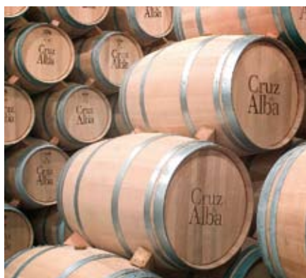
Sala de barricas de Cruz de Alba

Tras acabar la transformación de azúcar en alcohol y extraer el máximo de aromas y color de la uva, el invierno es tranquilo en la bodega, el enólogo de Cruz de Alba, cata casi a diario, como si fuese un ritual prácticamente todos los depósitos. De vez en cuando, toma una muestra y la analiza. Lo que está haciendo es el control de la fermentación maloláctica. Parte de nuestros vinos la hacen en las barricas nuevas compradas al efecto entre octubre y noviembre. Para la fermentación maloláctica, que se desarrolla de forma espontánea en los vinos, es fundamental la temperatura. Debe haber pocas variaciones y así las bacterias lácticas trans-