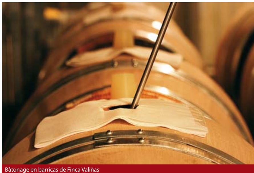
Bâtonage en barricas de Finca Valiñas