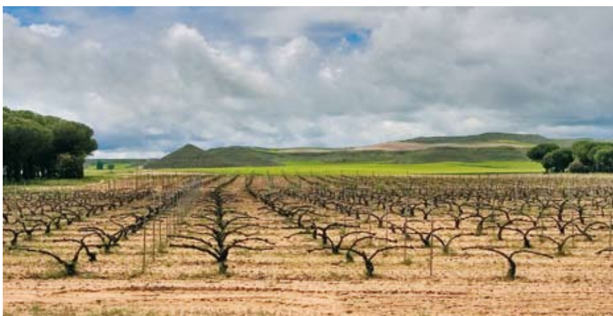
Vista parcial del viñedo de Cruz de Alba

Durante el invierno la labor fundamental es la poda, pero en el campo se desarrollan otras actividades también importantes. Después de la vendimia, tras justo retirar los racimos, se aplica un tratamiento fungicida, en este caso con "caldo bordeles" que es cobre en polvo azul y que es uno de los tratamientos permitidos en agricultura ecológica. Se realiza, para favorecer que si llegan tarde las heladas de invierno la hoja siga "trabajando", siga haciendo la función clorofílica y por lo tanto acumulando nutrientes para que la brotación primaveral, que se hace con estas reservas al año siguiente, sea vigorosa y homogénea. Otra de las labores que se hace y también importante en la viticultura sin apoyo de riego como es la de Cruz de Alba. Es el labrado de invierno, que se hace con un cultivador arrastrado por el tractor y que pre-