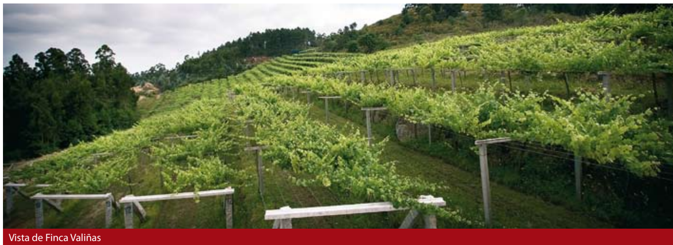
Vista de Finca Valiñas

Tras la vendimia, el campo reposa un breve tiempo antes de dar comienzo a las tareas de mantenimiento del viñedo, propias del invierno. A pesar de los rigores invernales a que nos hemos visto sometidos en Galicia desde el pasado mes de Noviembre, el programa de trabajo se ha seguido sin retrasos, y así hemos dado fin a la poda y atado. Casi paralelamente, preparando el terreno para la replantación en primavera, hemos ido reparando las terrazas, arrancando las cepas muertas en el viñedo y mar-